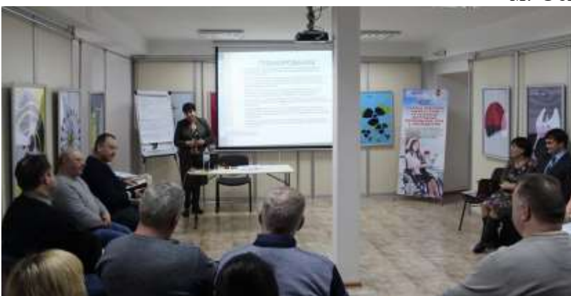
м. Харків, семінар «Активний правозахист»