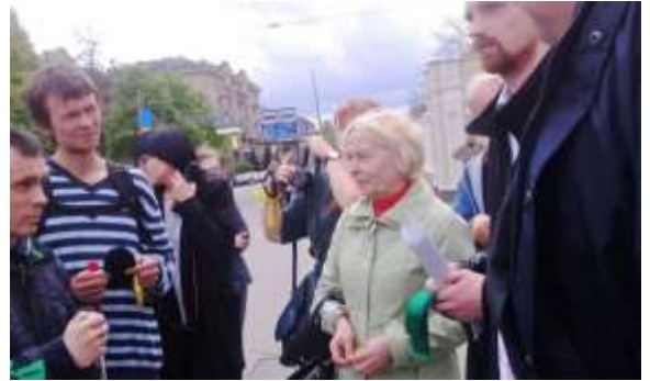
Квест-акція «Крізь місто на дотик», м. Харків

У м. Добропілля вуличні акції були спрямовані на реалізацію колективних дій із громадою міста та проводилися з метою благоустрою території. Серед досягнень – організація акції «Білицьке – місто троянд». Тут увага приверталась настільки до наявних проблем ВПО з інвалідністю, а до їх потенціалу і ролі в міській громаді, і подоланню стереотипного ставлення до ВПО та людей з інвалідністю як таких, що тільки потребують тільки допомоги з боку суспільство, а вуличні екологічні акції із залученням представників цих груп свідчать, що в сфері соціальних ініціатив кожна група може робити свій вагомий внесок у формування громадянського суспільства.