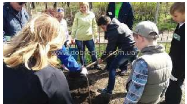
м. Добропілля, вуличні акції