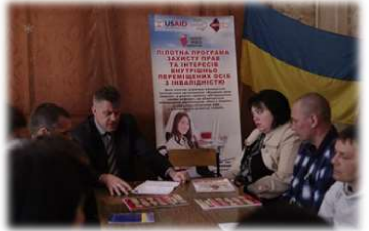
Круглий стіл «Інтеграція ВПО в місцеву громаду», м. Білицьке Донецької обл.

Харків та область є одним з найбільших осередків внутрішньо переміщених осіб (станом на березень 2016 року). Пілотна програма з захисту прав та інтересів внутрішньо переміщених осіб з інвалідністю виконувалась Харківською громадською організацією «Союз Чорнобиль» у співпраці з іншими громадками організаціями міста та області.