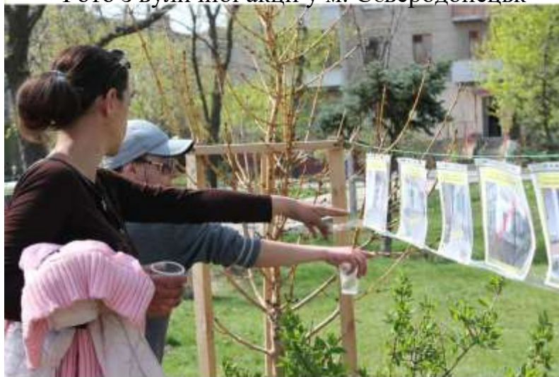
Фото з вуличної акції у м. Северодонецьк

Вуличні акції у різних форматах були проведені у всіх чотирьох областях, що взяли участь у пілотному проекті, але у всіх областях, де виконувалась Пілотна програма, вони мали власну унікальну специфіку.